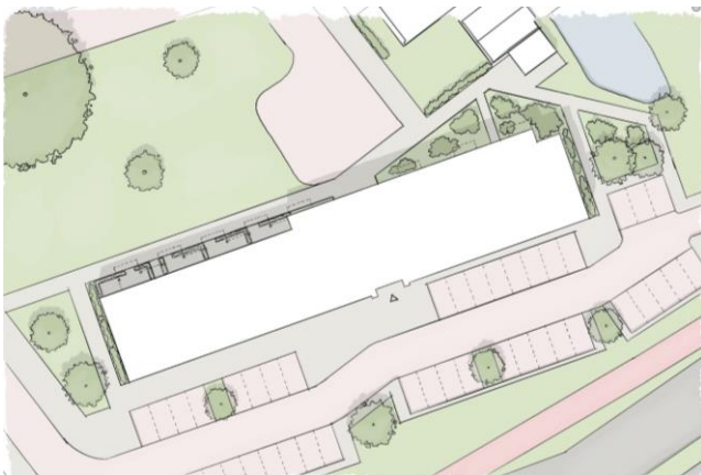
Eerste schets buitenruimte

We onderzoeken of de ecologische zone langs het Kerstaniepad meer ruimte kan krijgen aan de noordkant van het woongebouw. Ook onderzoeken we op welke manier we de openbare ruimte tussen het woongebouw en de Prinses Beatrixlaan aantrekkelijker kunnen maken.